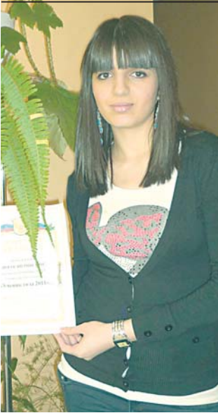
С 10 по 14 февраля в школе №897 проходил конкурс «Ученик года-2011». Ученики 9-11-х классов принимали участие в состязаниях по номинациям «Интеллектуал», «Лидер», «Творческая одаренность».

Конкурсные задания в каждой номинации были по-своему сложны и интересны. Конкурс дал положительные результаты не только для участников и победителей (а каждый из них был отмечен на школьной линейке), но и для педагогов, т.к. в процессе участия в конкурсе ребята раскрыли себя с разных сторон. Каждый участник ответственно отнесся к выполнению конкурсных испытаний.