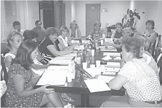
Ставший традиционным «круглый стол», организованный муниципалитетом Старое Крюково, на этот раз был посвящен теме «Сопровождение семей, попавших в трудную жизненную ситуацию. Опыт работы и проблемы».